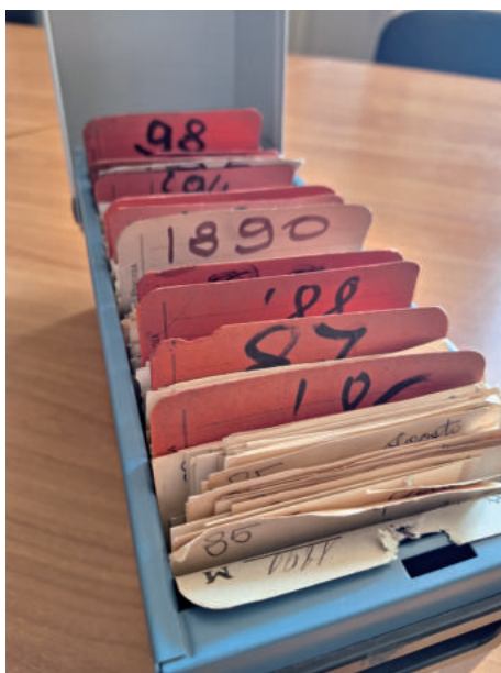
2. L'interno degli schedari

so. Gli schedari dal primo al quarto sono suddivisi cronologicamente: n. 1, anni 1848-1872; n. 2, anni 1873-1884; n. 3, anni 1885-1898; n. 4, anni 1899-1914. Il n. 5, invece, ha una doppia suddivisione: nella prima parte segue cronologicamente, come nei precedenti schedari, gli anni 1915-1961 2 , mentre nella seconda e più ampia parte è suddiviso per argomenti: cose , personaggi , prefetti , giornali e una preziosa bibliografia finale. Si noti che, nello schedario n. 5, l'indagine si spinge, in alcuni casi, sia pure non sistematicamente, oltre il 1915.