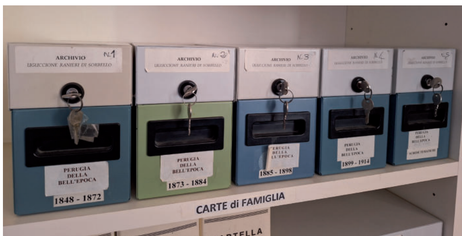
1. I cinque schedari nell'archivio di Palazzo Sorbello