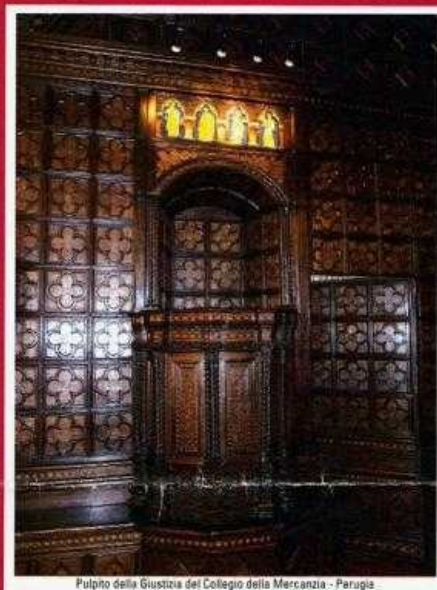
Pulpo della Giustizia del Collegio della Mercanzia - Perugia.

Centro Studi Giuridici e Politici della Regione Umbria